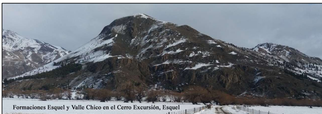
Formaciones Esquel y Valle Chico en el Cerro Excursión, Esquel

Centro de Investigación Esquel de Montaña y Estepa Patagónica (CIEMEP), Esquel, Chubut, Argentina